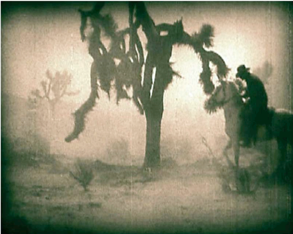
Extraits de Clash of the wolves , directed by Noel Mason Smith, 1925