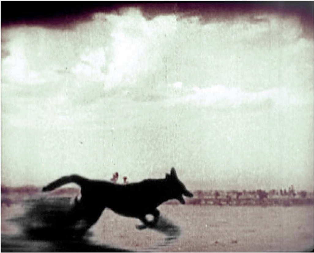
Extraits de Clash of the wolves , directed by Noel Mason Smith, 1925